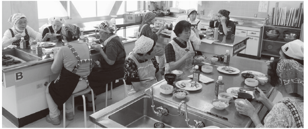
試食しながら感想交流