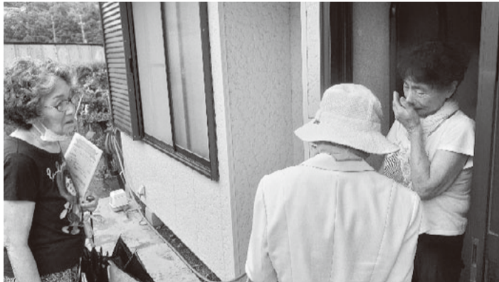
組合員さんのお宅を訪問しました

これは、葉山町が実施している特定健診・長寿健診・がん検診について委託を受けて実施するもので、葉山町民の方が受けられる健康診断です。昨年からは山町との協力で実施しています。葉山町の広報やホームページ、町内会の回覧板などにお