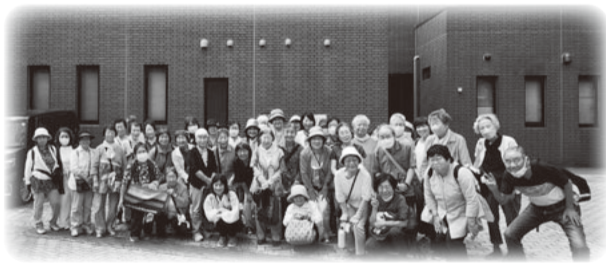
43名が参加したバスツアー

6年前から気候変動や海洋漂流ごみの探査、国際交流を目的として自ら操船するヨットによる太平洋の航海を始めたそうです。航海日数は延べ270日、航海距離は2万9000キロメートルにも及ぶそう。航海で見た「ごみだらけの太平洋」の様子などを40年間撮影してきた水中映像とともに報告されました。気候危機に立ち向かう運動と核廃絶、平和運動、「どちらも地球を救うために声を上げ続ける運動」と訴えました。