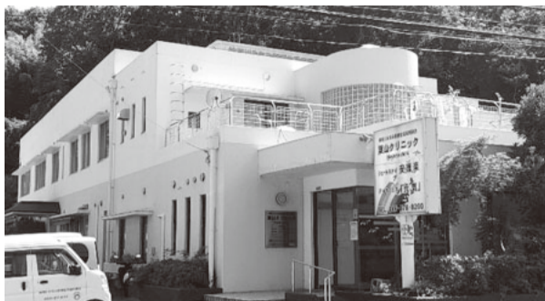
「安護楽」「元気」も上山口です

上山口は葉山町の東部に位置し、一色、下山口、木古庭、横須賀市と隣接しています。神奈川みなみ医療生協の介護施設「ショートステイ安護楽」「デイサービス元気」も上山口にありす。