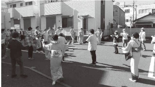
エンディングはみんなが輪踊り(みうら)