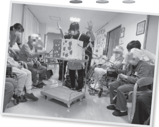
白熱の綱引き! 勝負の行方は!?

開会式では、安護楽らしく愉快的選手宣誓を行い、準備運動をしっかりとしてから開始。