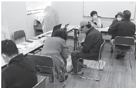
午前中の健康チェック

2024年10月末現在 組合員数 13,276人 / 出資金 375,295,500円