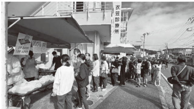
模擬店は大盛況(横須賀)