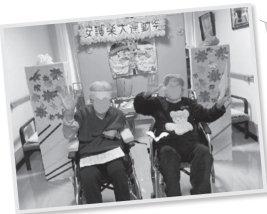
選手宣誓をする利用者さん