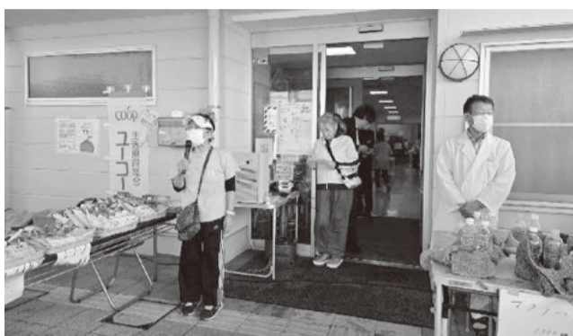
実行委員長の挨拶でスタート(みうら)

11月3日(日)、前日の雨がうその様に良い天気に恵まれた「みうら健康まつり」。地域の作業所やNPO法人の方も出店し、模擬店は大盛況でした。オープニングはみんなでラジオ体操で体をほぐし、2団体の踊りで盛り上がりました。診療所内では医療講演や健康チェックの企画が人気でした。エンディングは南浦支部のみなさんの指導のもと「みんなで輪踊り」でしめくくりました。