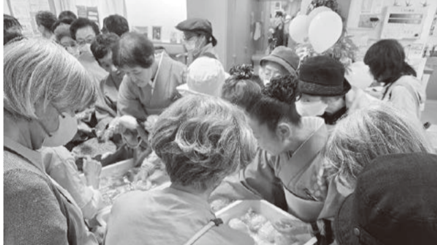
模擬店も大盛況(みうら)