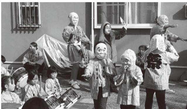
オープニングの子ども太鼓(横須賀)