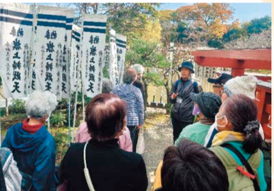
鶴岡八幡宮内の旗上弁財天社

の屋敷跡とされていたので、その地に幕府を建てようとしたが、スペースなどの問題で断念し、その後寺を開くことになったとのこと。北条政子と源実朝のお墓が裏山の墓苑にあります。境内は中門までは入れますが、その先の仏殿を拝観することはできないので横の通路から参詣しました。お正月とゴールデンウィークには境内が特別に解放されるそうです。英勝寺は寛永十三年(1636年)、徳川家康