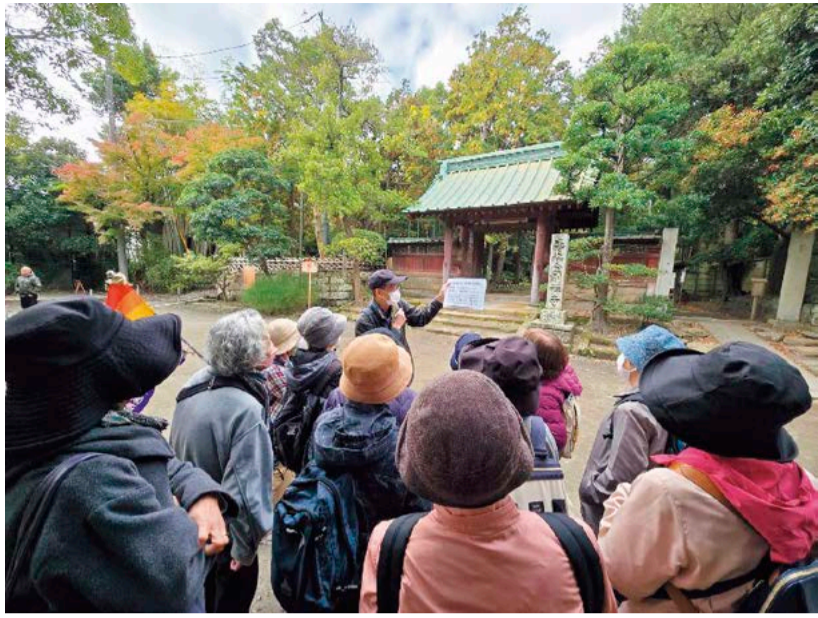
寿福寺の山門でガイドさんと

参加した皆さんからは、「これまで何度も来たところだけれども、いれなどガイドさんの話を聞くことが出来てはじめて知ることも多かった。」「みんなと歩いて楽しかった。」「などの声を頂きました。来年もウォーキング企画を開催したいと思います。ぜひご参加ください。」