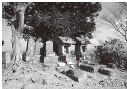
三浦富士山頂の祠

※富士講:富士山を信仰する人々が組織した信仰的な集団で、江戸時代後期から昭和初期にかけて庶民の信仰として広まりました。