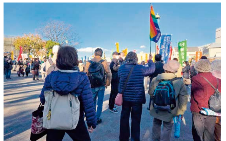
みなみ医療生協 63人が参加しました。