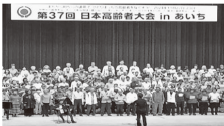
オープニングの300人合唱団