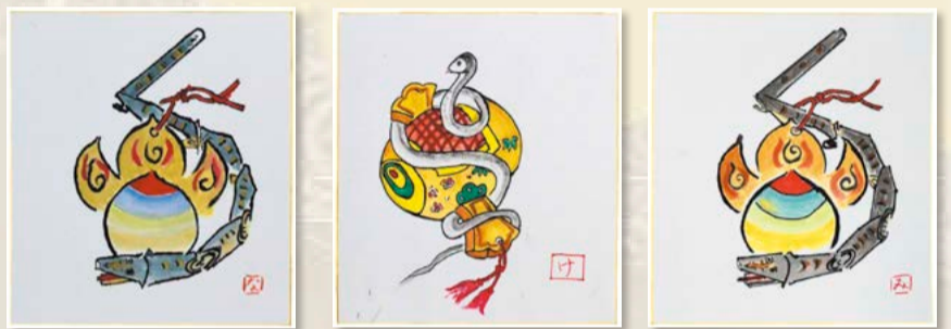
ひなの会(南下浦支部)の皆様の作品