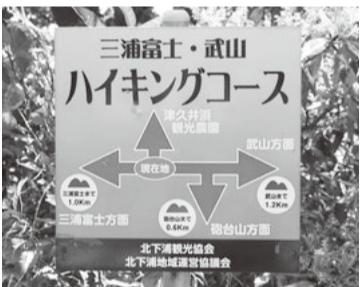
ハイキングコースも整備