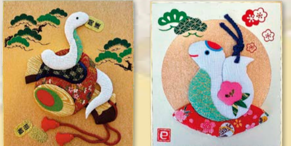
浦賀支部のみなさまの絵手紙